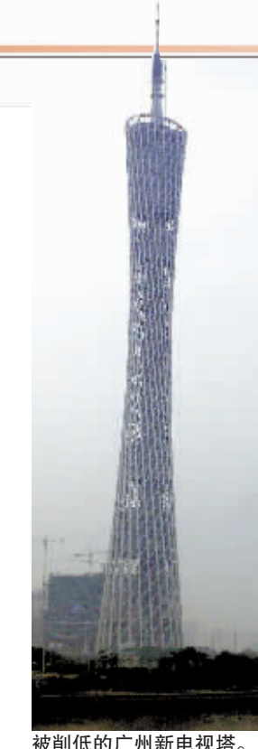
被削低的广州新电视塔。

昨日,“小舅子”又出现在施工现场,他除了来看拆除的进展,还向记者苦诉,“希望政府考虑我们的感受,把那些钢筋还给我们。”(佛山传媒集团广州新闻工作站见习记者 胡国球)