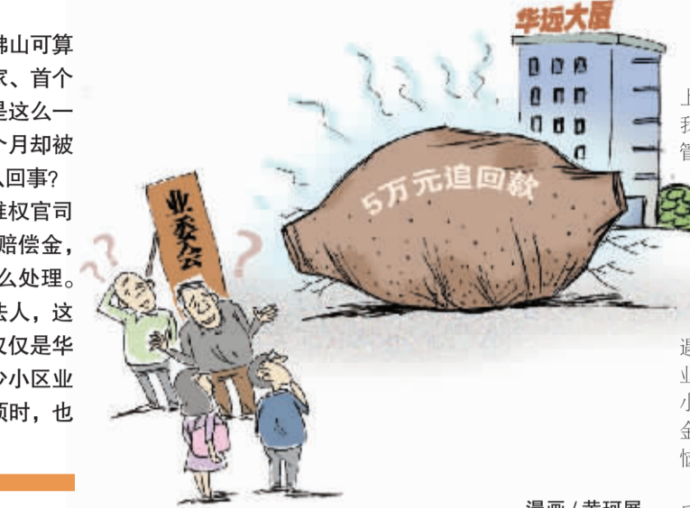
漫画 / 黄珂展

出华远大厦管理后遗留问题产生纠纷,业委会对原“管家”提起的上诉在去年12月有了最终判决。法院一审判决被告向原告返回水电周转账48434.58元外,还要向原告赔偿水费损失1200元。