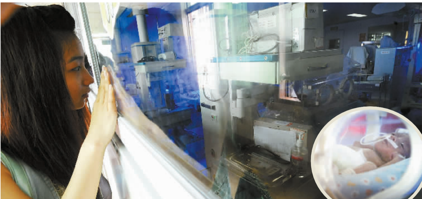
▲龙凤胎BB的小姨正在南海妇幼保健院护理室外观看孩子情况。▶BB已除去呼吸机。

昨日下午,记者在高明区灵龟塔下的西江边看到,大批市民聚集在此野泳,有游泳者表示有衣服被偷的经历。“现在我游泳时经常看着衣服,而且不带手机及钱财。”刚游泳上岸的李叔说,就在上个月,他在西江边游泳时,衣服被偷了,只得“光身”回家。